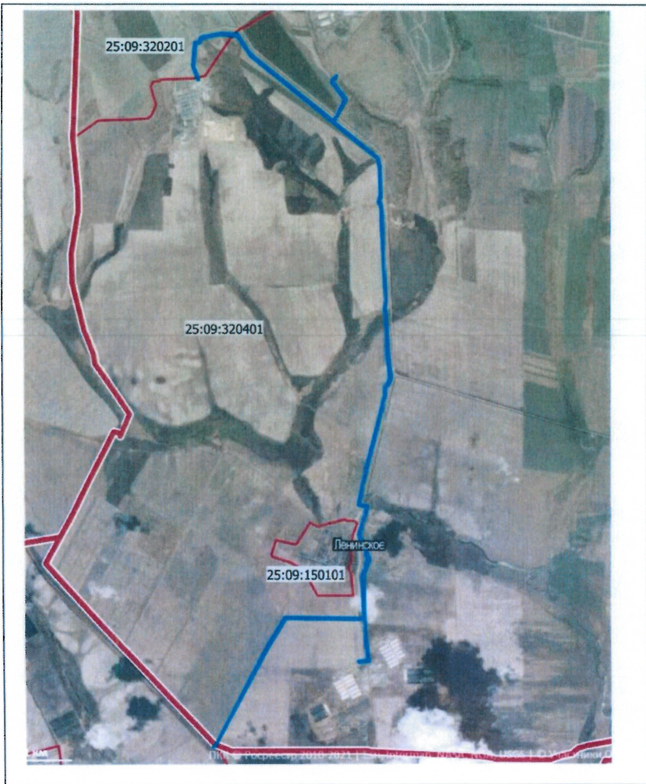
Схема расположения публичного сервитута линейного объекта

■ - границы публичного сервитута планируемого для установления в целях размещения объекта : "Межпоселковый газопровод с. Степное - с.Элитное - с.Галенки с отводами к площадкам ООО "Группа Компаний "Русагро" Михайловского района Приморского края"