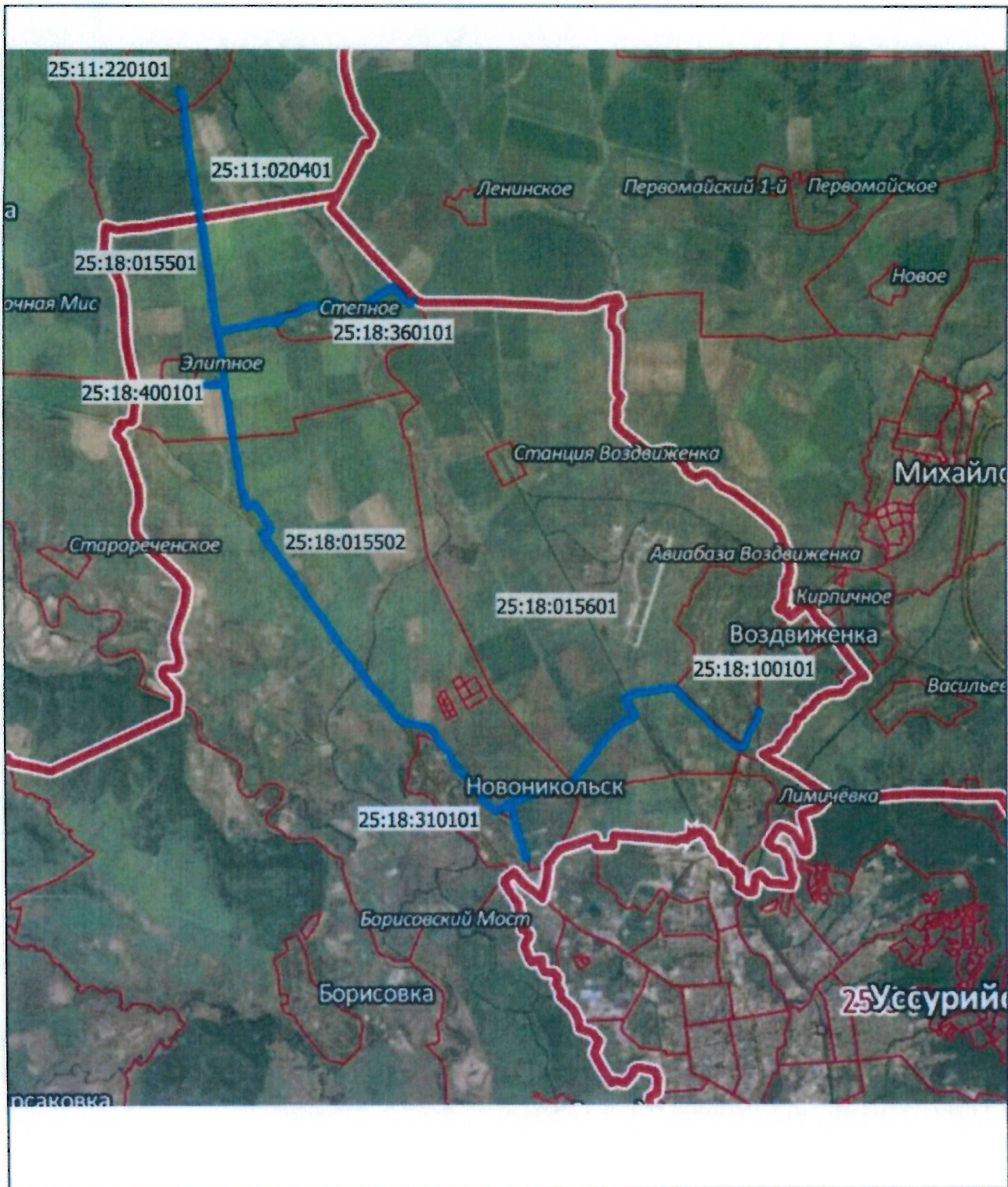
Схема расположения публичного сервитута линейного объекта